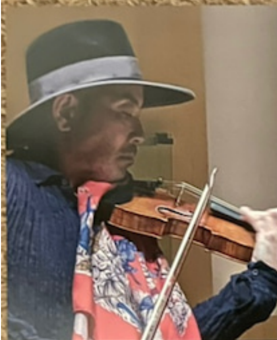
古澤 巖 ヴァイオリン