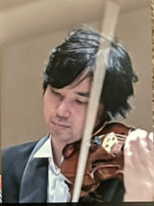
福田 悠一郎 ヴァイオリン